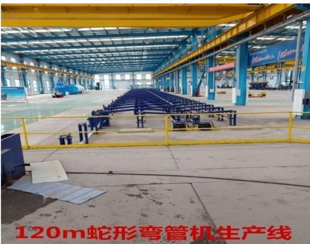
120m蛇形弯管机生产线