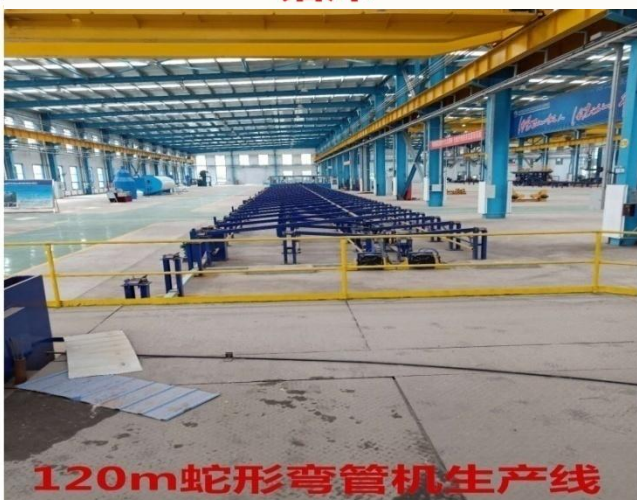
120m蛇形弯管机生产线