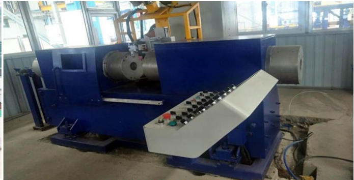
大型管管对接设备