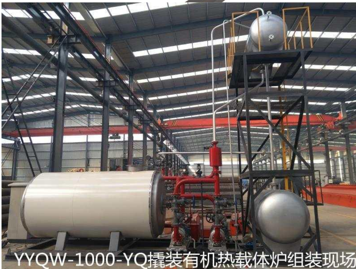
YYQW-1000-YQ撬装有机热载体炉组装现场